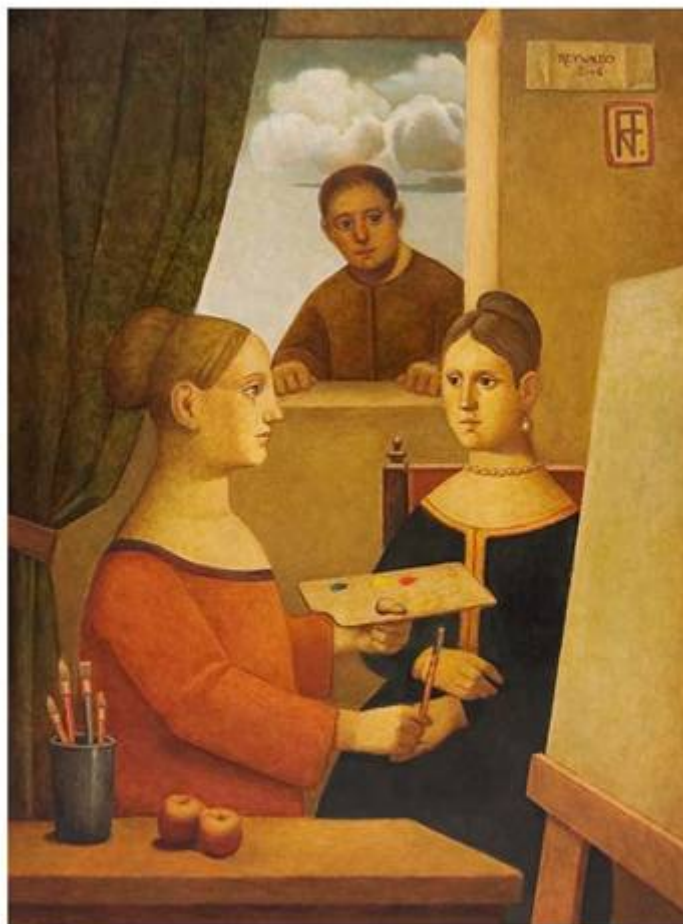
Pintora e o Modelo 160 X 120 cm Óleo sobre placa Ass. Sup. Dir. 2006

Vernissage dia 11 de Agosto, sábado, 10h