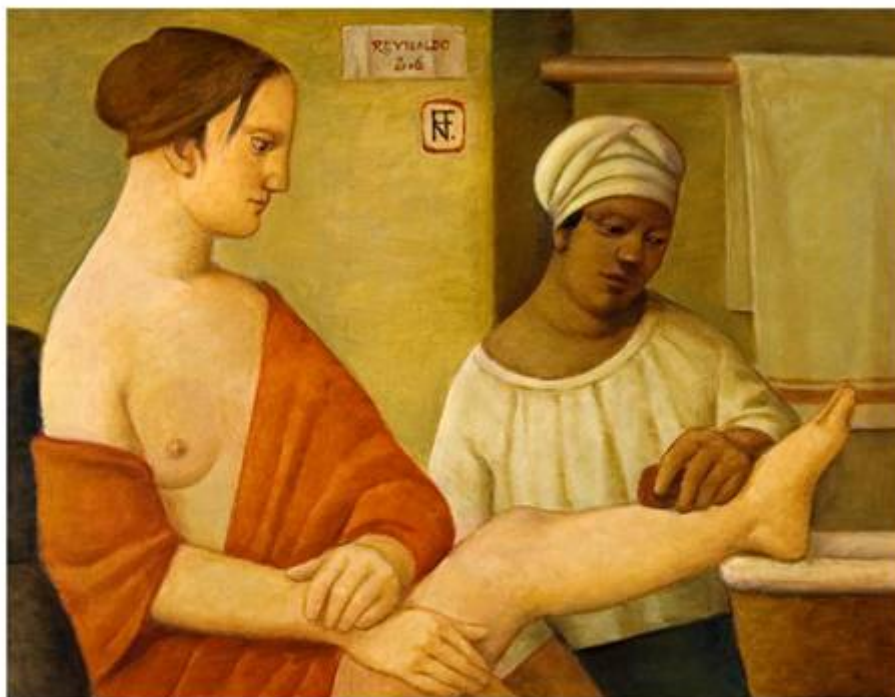
Banho Óleo sobre Tela 60 X 80 cm 2006

"É na confessada admiração por certos gênios de outros tempos, enfim, que ele busca a chave para algumas de suas soluções. Lembra, por exemplo, o vermelho das capas das personagens de Van Eyck como provável explicação de seu fascínio por esta cor".