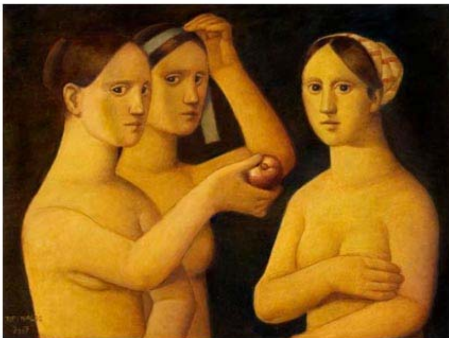
Mulheres e Maça Óleo sobre Tela 80 X 60 cm 2007