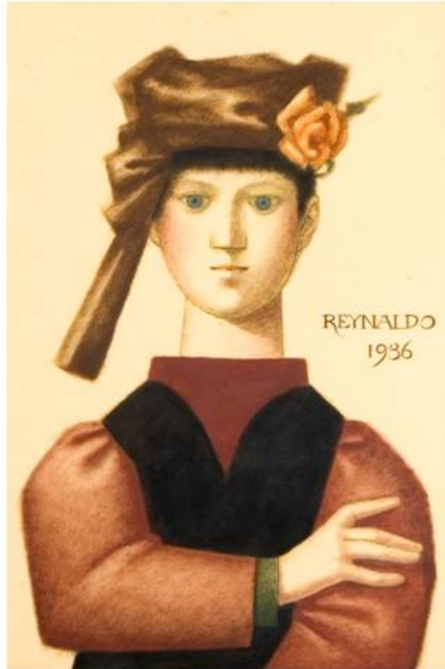
Figura Feminina Renascentista Pincel Seco 50 X 35 cm 1986